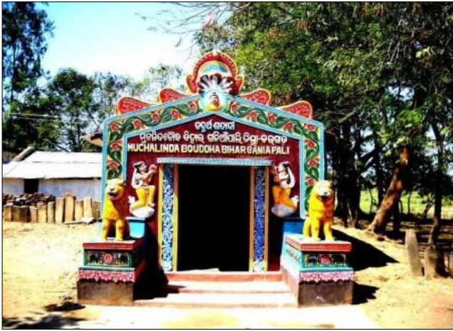
ଚିତ୍ର-୧: ମୁଚାଲିଣ୍ଡା ବୁଦ୍ଧ ବିହାର, ଗଣିଆପାଲି ।