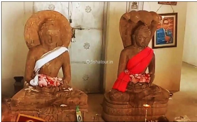
ଚିତ୍ର-୨: ଗାନିଆପାଲିର ମୁଚାଲିଣ୍ଡା ବିହାର ଭିତରେ ବୁଦ୍ଧଟି ବୁଦ୍ଧ ଦେବତା ।